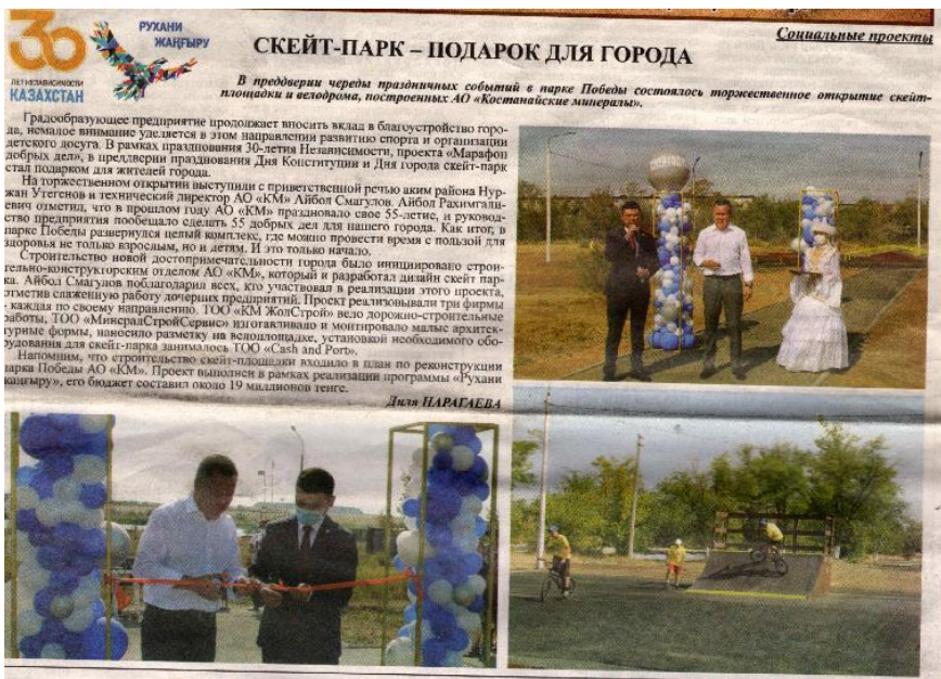
Скейт - парк - подарок для города [Текст]: [социальные проекты] / Д. Нарагаева; есть фото. //Житикаринские новости. – 2021.– 2 сентября. – С.